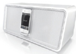
AU-7000W (ホワイト・ホワイト) Jan: 4951035050910