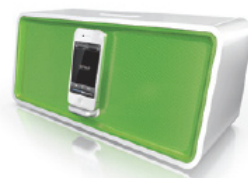
AU-7000G (ホワイト・グリーン) Jan: 4951035050903

お問い合わせ先:(株)ディーアンドエムホールディングス ディストリビューター営業部 神奈川県川崎市川崎区日進町2-1 044-670-6611