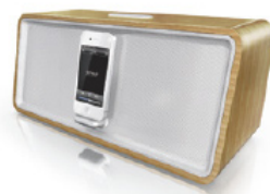
AU-7000BA (バンブー・ホワイト) Jan: 4951035050934