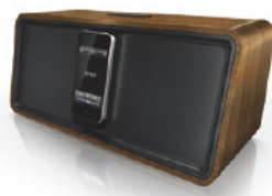
AU-7000WA (ウォールナット・ブラック) Jan: 4951035050927