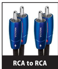
RCA to RCA

下記モデルの説明をお読みいただき、その特徴をつかんでいただけるよう、各上位モデルにおける新技術を太字で表示しています。