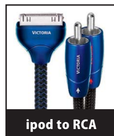
ipod to RCA