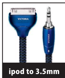
ipod to 3.5mm