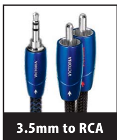
3.5mm to RCA