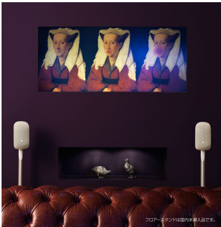
フロアスタンドは国内未輸入品です。

MT-50 優れた映画サウンドに必ずしも大型予算が必要とは限りません。当社の MT-50 システムは、大変価値があるだけでなく真の臨場感溢れる映画サウンドをお楽しみいただけます。MT-50 システムには、コンパクトでありながらもパンチのある ASW608S2 サブウーファーが採用されています。