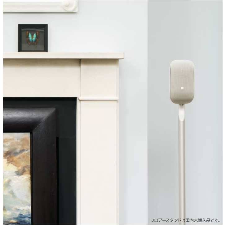
フロアスタンドは国内未導入品です。